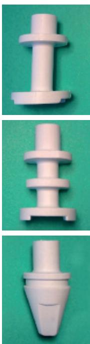
Farfalle sintetiche Synthetic mixers

• Frullini per frappè a tre tazze da banco con tazze trasparenti (mod. E) o in acciaio inox (mod. L)